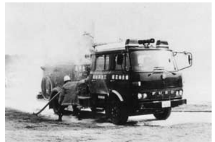
昭和58年 県北初 化学消防車を配備

12月20日 広島県同栄社共済連から救急車（2B型、トヨタハイエース）の寄贈を受け庄原消防署に配置