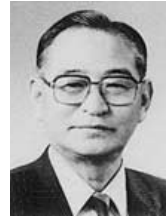
6代 林正 勝美 年数：6年1ヵ月 期間：平3.7.～9.7