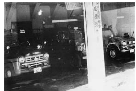
昭和45年 庄原消防署 庁舎完成