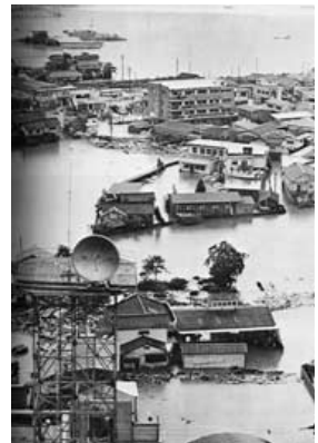
昭和47年 7月12日 三次市47年水害