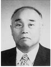
8代 中下 悦持 年数：9ヵ月 期間：平10.8.～11.4.