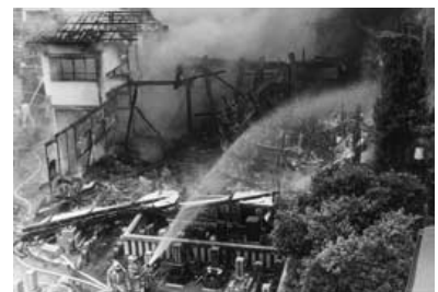
平成5年5月8日 三次町浄念寺火災