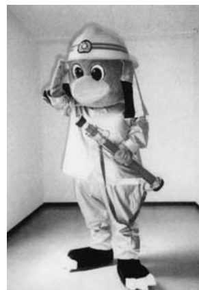
平成10年 自治体消防発足50周年事業 備北消防イメージキャラクター 「トンビ君」誕生