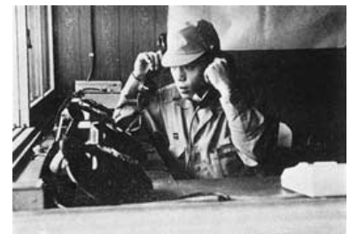
昭和46年 庄原消防署 警備室