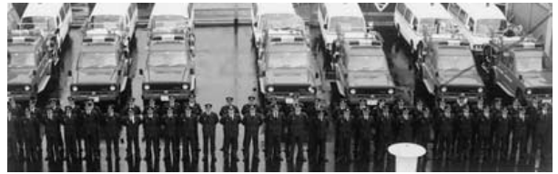
昭和57年 7出張所 ポンプ車・救急車・配車式

10月1日 三次消防署作木出張所・吉舎出張所・三和出張所・口和出張所・甲奴出張所・庄原消防署西城出張所・高野出張所業務開始