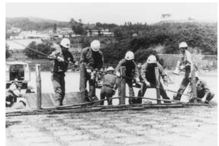
昭和53年 広島県総合防災訓練