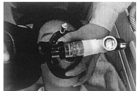
平成18年度消防機器の開発 消防庁長官表彰奨励賞 「呼吸管理補助器具（フィットマン）」