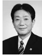
5代 吉岡広小路 年数：6年11ヵ月 期間：平13.5.14～20.4.17