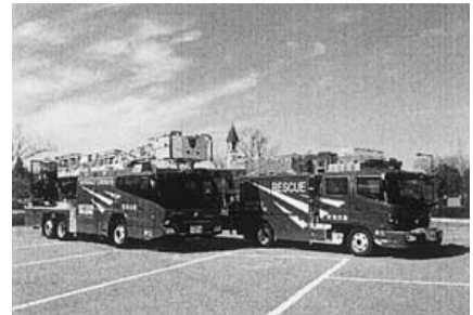
平成21・22年度 三次消防署救助工作車 30m級はしご車更新