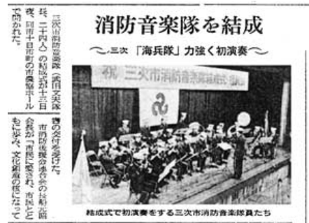
昭和63年 三次市消防音楽隊発足 (昭和63年7月15日付 中国新聞社提供)