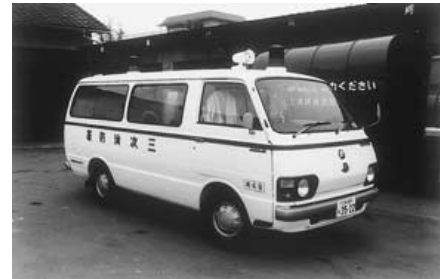
昭和44年 三次市消防署 救急業務開始