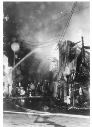
昭和61年 9月14日 庄原本町建物大火（18棟焼損）

8月26日 日本損害保険協会から消防ポンプ車（BD-Iニッサン）の寄贈を受け三次消防署に配置