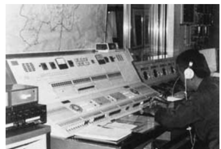
昭和57年 三次消防署 消防・救急指令装置導入