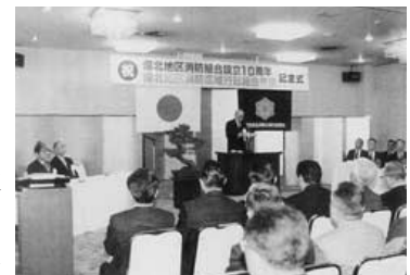
平成5年2月15日 備北地区消防組合設立10周年 備北地区消防広域行政組合発足記念式典