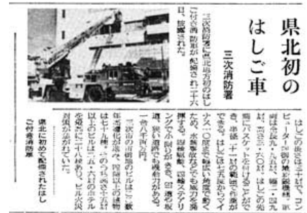
昭和63年 県北初 はしご車配備

9月13日 日本防火協会から防火広報車（いすゞファーク）を備北地区消防組合幼少年婦人防火委員会に寄贈を受ける