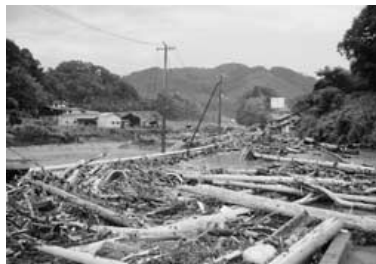
平成22年7月16日 庄原市ゲリラ豪雨災害