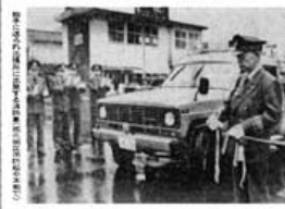
備北地区消防組合も 7出張所 15市町村カバ!