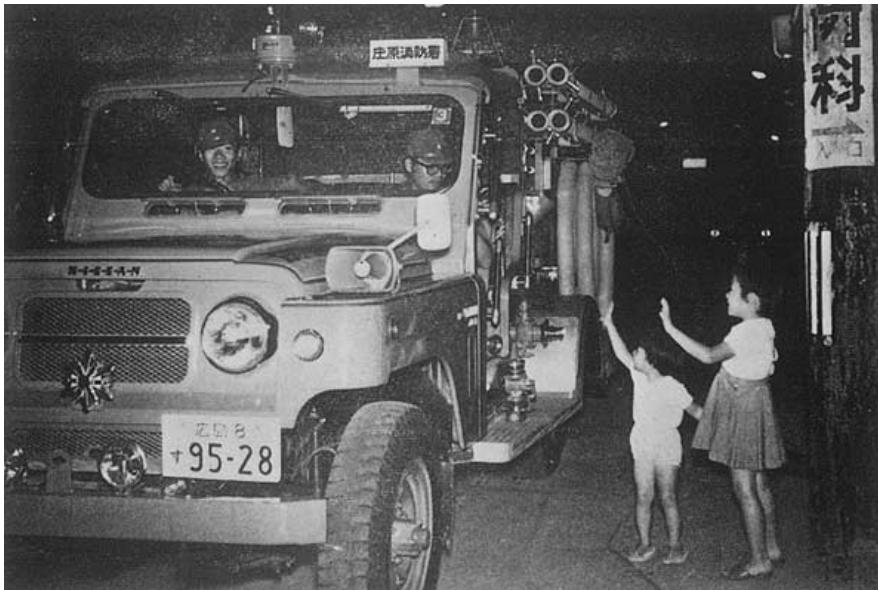
昭和46年 庄原消防署 夜間広報