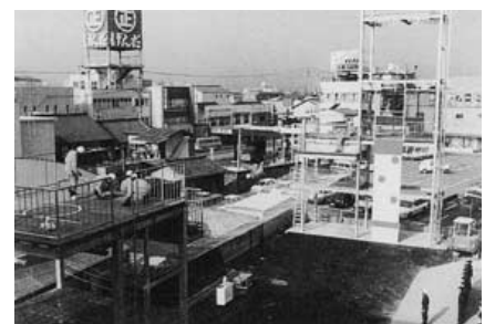
平成2年 三次消防署訓練塔 竣工