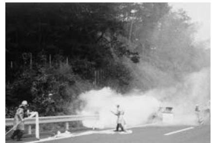
昭和53年 中国自動車道開通に伴う訓練