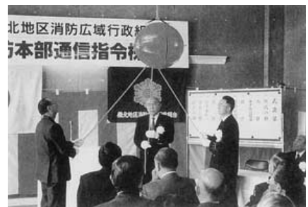
平成9年 消防本部通信指令棟竣工