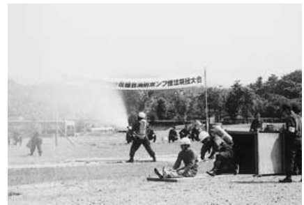
平成14年 消防ポンプ操法競技大会

12月16日 三次消防署口和出張所に高規格救急車（トヨタハイメディック4WD）配置