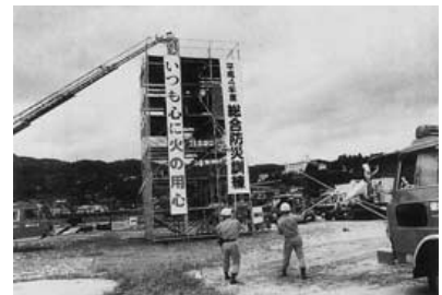
平成4年 広島県総合防災訓練