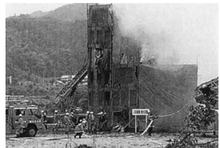
平成8年8月28日 備北地区総合防災訓練